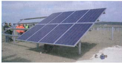
Das erste von 14.000 Modulen auf rund 70.000 Quadratmetern ist installiert.

Im letzten Heft stellten wir das neueste Sachwertportfolio abakus balance 3. KG des Spezialanbieters abakus Finanz vor. Der aktuell vornehmlich im Bankenbereich angebotene Sachwertfonds meldet nun bereits erste Investitionen aus platziertem Eigenkapital. Besonders hervorzuheben ist ein 3-MW-PV-Park zwischen Ulm und Augsburg. Stabile Rückflüsse, überschaubares Risiko und die Unabhängigkeit zum Kapitalmarkt sprechen für Solarinvestments. Einzig die Fondsrendite deutscher Kraftwerke lag bisher meist auf bescheidenem Niveau. Das abakus Fondsmanagement schaltet daher konsequent Zwischenhändler aus und konzipiert direkt in Zusammenarbeit mit regionalen Banken. So erstrahlen auch die Rückflüsse in sonnigem Licht.